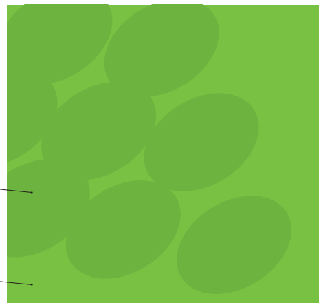
Pantone 368 c